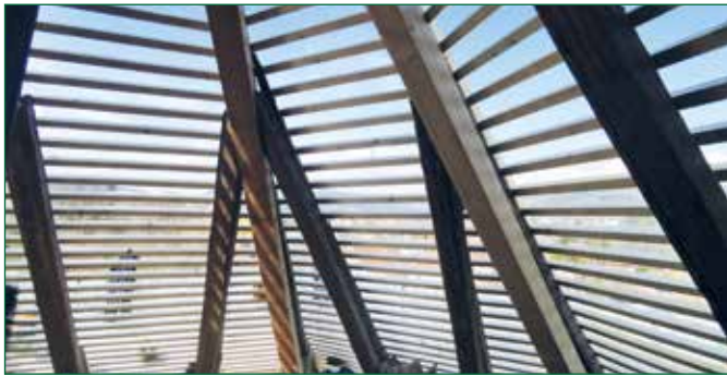
Abbildung 2: neue Dachlattung