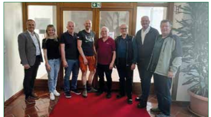
Abbildung 6: Der Vorstand vom Verein mobil50plus, dem Betreiber des Carsharings Naturpark Pöllauer Tal

Weitere Informationen und Anmeldung unter carsharing.poellauertal.com sowie bei Reinhold Schöngrundner (0677 62463414)