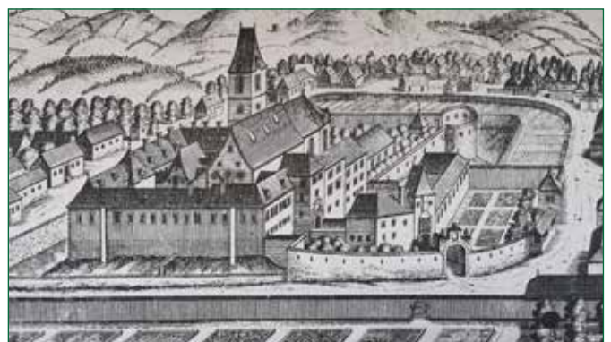
Abbildung 4: Vitscher Stich 1681