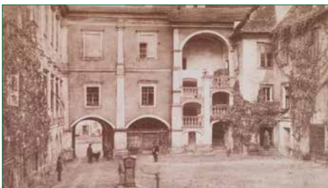
Abbildung 3: historischer Brunnenhof