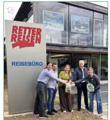
Abb.3.: Aussaat gemeinsam und bei Retter Reisen

Interessierte melden sich direkt beim Naturpark Pöllauer Tal oder unter: oststeiermark.at/naturnetzwerk-oststeiermark