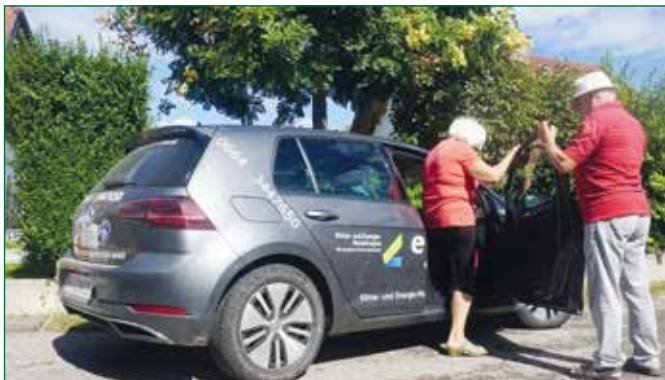
Abbildung 3: Begleitender, ehrenamtlicher Mobilitätsdienst im Naturpark Pöllauer Tal

Was wir machen? Wir holen Menschen von zu Hause mit einem Elektro-Auto ab und bringen sie zu ihren Zielorten (Einkauf, Arztbesuch, etc.) und anschließend wieder nach Hause. Ebenso stellen wir Essen zu.