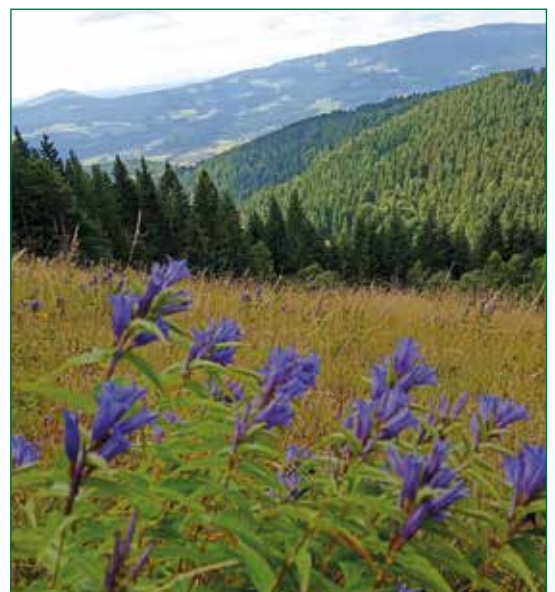
Abb.1.: Naturschutzgebiet Enzianwiese am Masenberg, credit: Naturpark Pöllauer Tal

Anmeldungen sind im Naturparkbüro möglich. Die Aktion findet in Zusammenarbeit mit KLAR! Naturpark Pöllauer Tal im Rahmen des ELER-Projekts „Biotopverbund im Naturpark Pöllauer Tal“ statt.