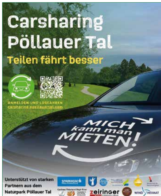
Abbildung 5: Carsharing Naturpark Pöllauer Tal

Carsharing Naturpark Pöllauer Tal feiert und setzt gleichzeitig ein starkes Zeichen für die Zukunft nachhaltiger Mobilität in der Region. Anlässlich dieses Jubiläums gibt es für alle Neueinsteiger:innen ein besonderes Geschenk: Die kostenlose Erstfahrt im Wert von 40 Euro.