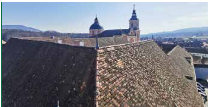
Abbildung 4: Blick über die Dachlandschaft des Schlosses Pölla