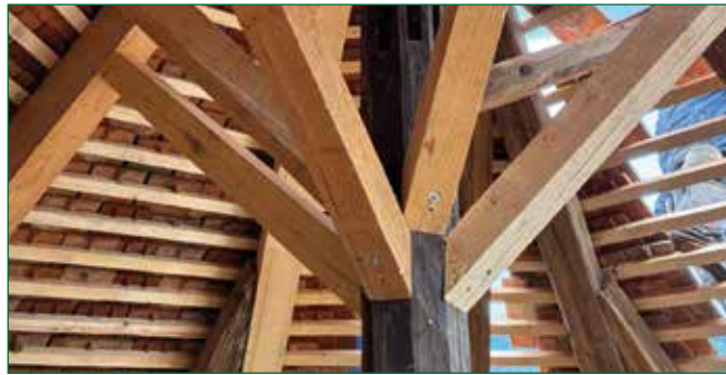
Abbildung 3: neue Sparren mit Verstrebungen