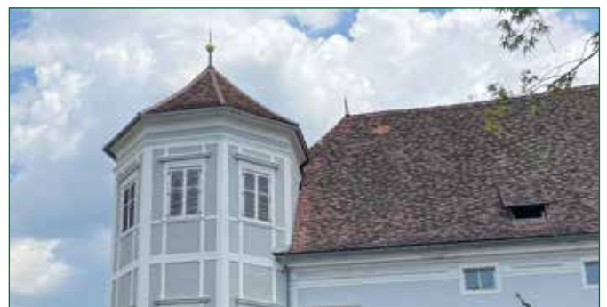
Abbildung 1. Erkerturm erscheint in neuem Glanz

Mit einer Altersbestimmung konnten die Holzsparren mit 1759 datiert werden.