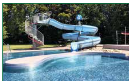
FREIBAD PÖLLAU erfolgreich in die Badesaison gestartet Seite 11