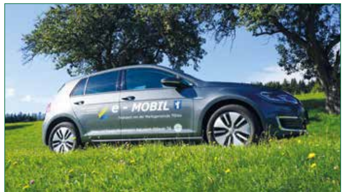
Abbildung 4: Elektroauto für den begleitenden, ehrenamtlichen Mobilitätsdienst im Naturpark Pöllauer Tal

Wir suchen ehrenamtliche Fahrerinnen und Fahrer. Geeignet sind fitte und mobile Menschen jeden Alters, denen der Kontakt zu Mitmenschen Freude bereitet.