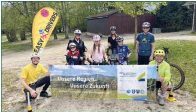
Abbildung 1: Ein Teil der Gruppe beim Eltern-Kind-Radtrainings

Das zweistündige Training wurde organisiert von der Klima- und Energie-Modellregion Naturpark Pöllauer Tal. Die erfahrenen Trainer von der Easy-Driver-Fahrradschule vermittelten praxisnah Technik und Sicherheit, darunter richtiges Bremsen, Helmtragen und Notbremsungen.