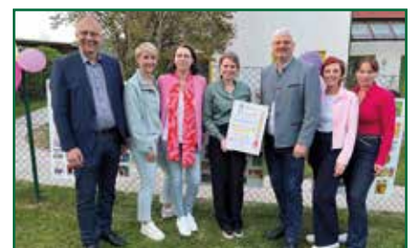
10 JAHRE KINDERKRIPPE ein Fest voller Freude und Erinnerungen Seite 18