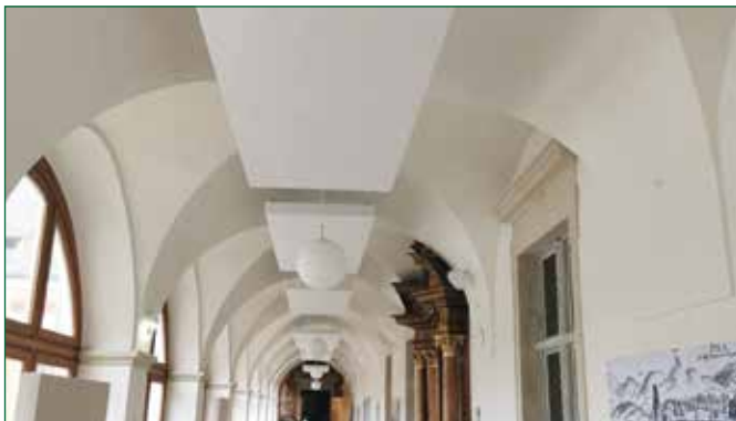
Abbildung 1: abgehängte Deckenelemente

und drei Wandelementen mit historischen Aufnahmen/Darstellungen im zentralen Veranstaltungsbereich des Schlosses Pöllau konnte die Akustik wesentlich verbessert werden.