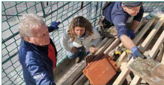
Abbildung 5: Begutachtung durch das Bundesdenkmalamt