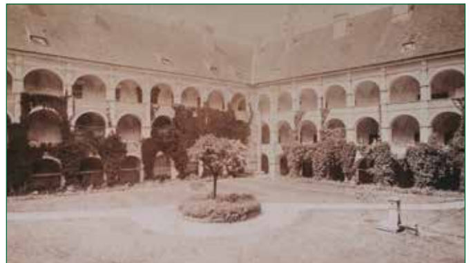
Abbildung 2: historischer Schlosshof