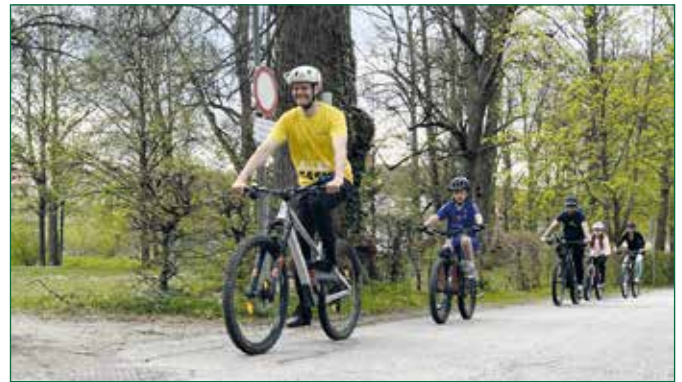
Abbildung 2: Abschließende Ausfahrt beim Radtraining

Das Projekt "Klima- und Energie-Modellregion Naturpark Pöllauer Tal" wird aus Mitteln des Klima- und Energiefonds gefördert und im Rahmen des Programms "Klima- und Energie-Modellregionen" durchgeführt.