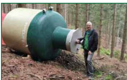
NETZWERK TRINKWASSER in der Marktgemeinde Pöllau Seite 10