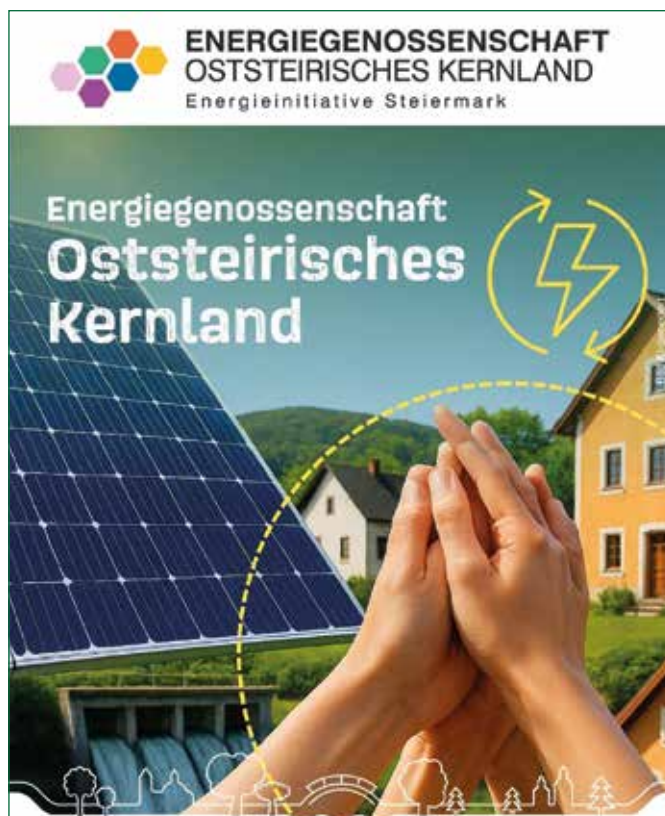
Abbildung 7: Energiegenossenschaft Oststeirisches Kernland [Grafik KEM Naturpark Pöllauer Tal]

Das Projekt „Klima- und Energie-Modellregion Naturpark Pöllauer Tal“ wird aus Mitteln des Klima- und Energiefonds gefördert und im Rahmen des Programms „Klima- und Energie-Modellregionen“ durchgeführt.