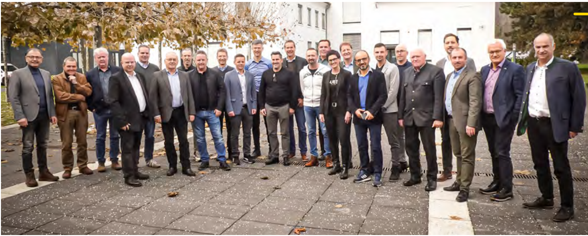
Mitglieder- versammlung mit dem GSA Vorstand im Dezember 2023