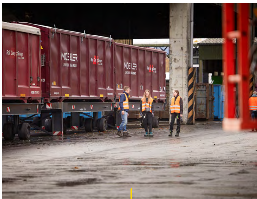
Mobiler-Bahncontainer auf einer Anlage

Als Fragen drängen sich auf: In welcher Trockensubstanz soll der Schlamm transportiert und verbrannt werden und welche Trocknungsanlagen werden dafür benötigt? Wo soll eine möglichst zentrale Verladung von der Straße auf die Schiene erfolgen und in welchen Gebinden kommt der Klärschlamm