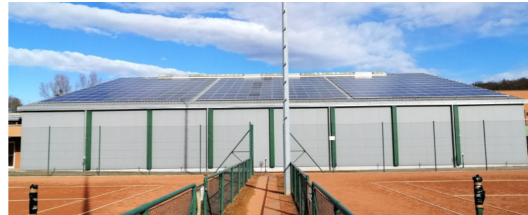
Photovoltaikanlagen mit insgesamt 465 kWp sind auf gemeindeeigenen Gebäuden ...

Anfang August wird die Öffentliche Bibliothek geschlossen und übersiedelt, spätestens ab September wird die neue „Gesamtbibliothek“ in der Schule zugänglich sein.