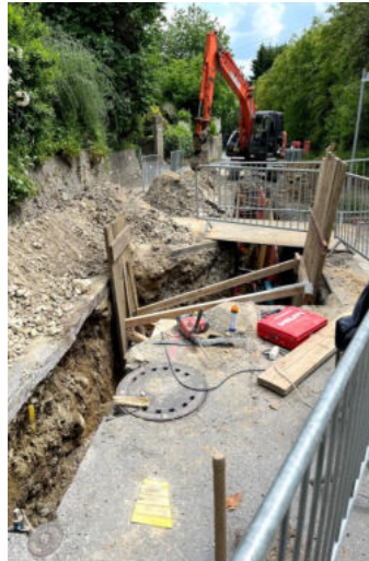
Leitungssanierung in der Hafnergasse

Von der Kinette über die Straße rauf aufs Dach – allorts werden im Gemeindegebiet Maßnahmen zur Verbesserung der Infrastruktur getroffen.