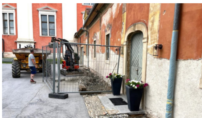
Voll im Gang: Sanierung der Kirchhoffassade