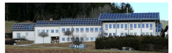
... bereits in Betrieb, weitere 135 kWp folgen noch heuer.