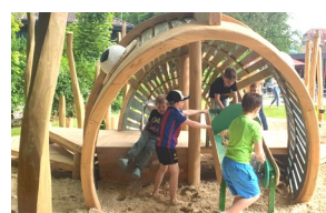
Betreuten Ferienspaß gibt's heuer von 10. bis 28. Juli.

Vor allem während der Ferienzeit stellt die Vereinbarkeit von Familie und Beruf für Eltern eine große Herausforderung dar.